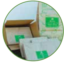
AJM PACKAGING CORPORATION