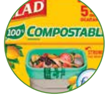
GLAD MANUFACTURING COMPANY