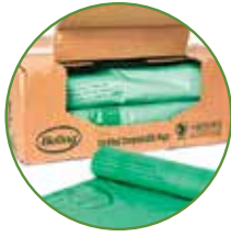
BIOBAG AMERICAS, INC