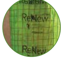
RENEW PACKAGING, LLC